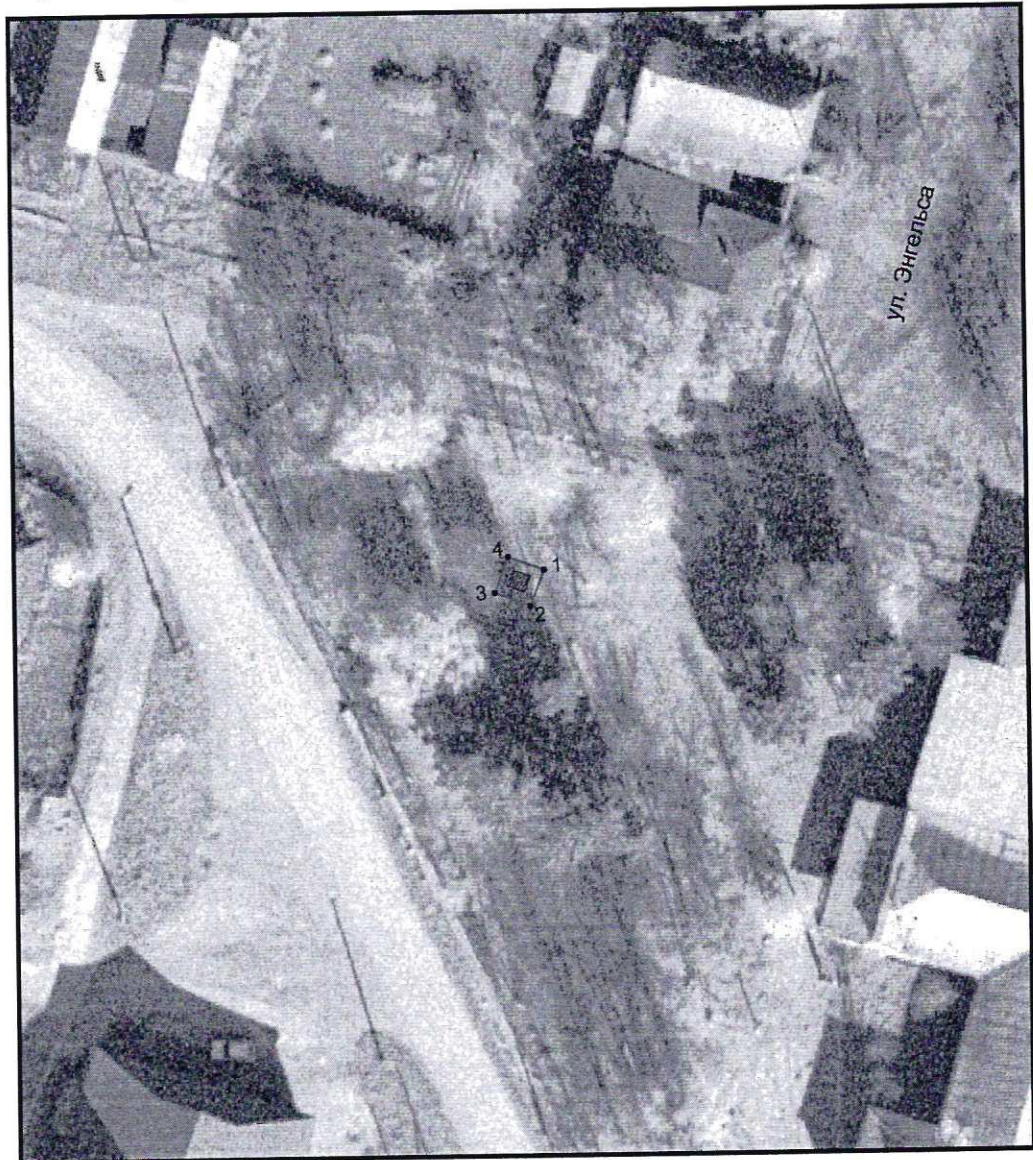
Условные обозначения к плану разбивки границ территории объекта культурного наследия регионального значения «Бюст К. Маркса»

1.1. План разбивки границ территории объекта культурного наследия «Бюст К. Маркса», расположенного по адресу: Челябинская область, поселок Нижний Уфалей, территория МОУ СОШ № 3.