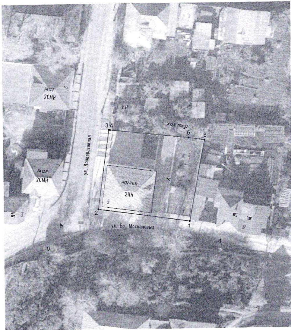
Условные обозначения к плану разбивки границ территории объекта культурного наследия регионального значения «Дом купцов Патриных»

1.1. План разбивки границ территории объекта культурного наследия «Дом купцов Патриных», расположенного по адресу: Челябинская область, город Усть-Катав, улица Мохначевых, дом 5.