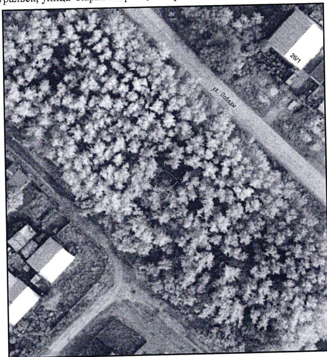
Условные обозначения к плану разбивки границ территории объекта культурного наследия регионального значения «Памятник коммунистам - основателям Советской власти в городе Верхнеуральске»

1.1. План разбивки границ территории объекта культурного наследия «Памятник коммунистам - основателям Советской власти в городе Верхнеуральске», расположенного по адресу: Челябинская область, город Верхнеуральск, улица Карла Маркса, сквер им. 50-летия Октября.